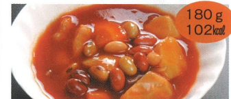
11. 大豆と根野菜のトマトソース煮 1食(B)