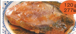
8. さばのみそ煮 1食(A)