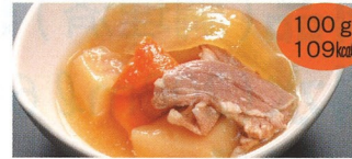
6. 肉じゃが 1食(A)