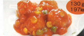
4. ミートボールのトマトソース煮 1食(A)