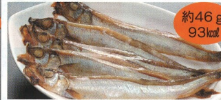
9. ししゃも焼(5尾) 1食(B)