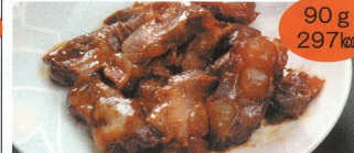
7. 軟骨チャーシュー 1食(A)