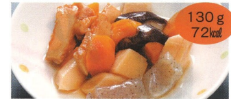
12. 筑前煮 1食(B)