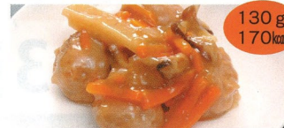
5. 中華風ミートボール煮 1食(B)