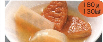
10. さつま揚げと大根の煮物 1食(A)