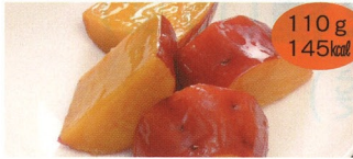
3. さつま芋の甘煮 2食(A・B)