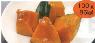
2. かぼちゃ煮 2食(A・B)