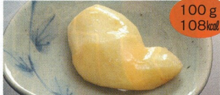
1. ジャがいも(バター風味) 2食(A・B)